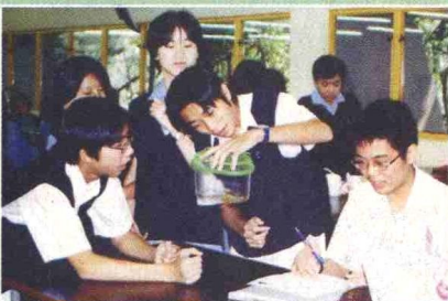
▲同學分組觀察及實驗，透過互相協作，共同揭開科學的奧秘。

進行科學探究，學生必須懂得運用科學方法解難。三位老師利用一套發展十年，不斷優化的教學系統，致力使生物科成為科學研究入門的基石。